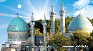
زیارت نگاه امامزاده سید حمزه (ع)

سه عنصر فطرت ، صداقت و سادگ در شهید مدرس جمع بود